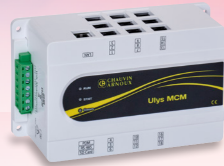
Coffret de mesure GridWatch

Une solution sur mesure fondée sur l'intégration du compteur multivoies Ulys MCM