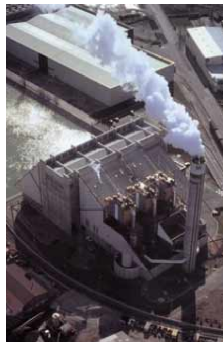
Usine d'incinération de la communauté urbaine de Lyon.