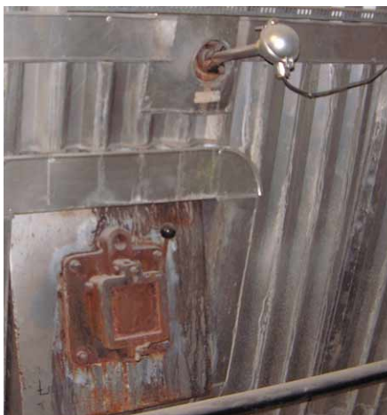
Capteur avec gaine « metal-ceramic » mesurant la température du foyer, placé à côté d'un regard de contrôle. Usine d'incinération au Mans.

Ce sont les capteurs à gaine « metal-ceramic » qui conviennent le mieux au contrôle de la température des fours d'incinération des ordures ménagères et des déchets industriels.